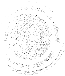
DR. ARTURO GARITA Secretario General de Servicios Parlamentarios

Se remite a las Honorables Legislaturas de los Estados y de la Ciudad de México, para los efectos del artículo 135 de la Constitución Política de los Estados Unidos Mexicanos.- Ciudad de México, a 28 de abril de 2023.